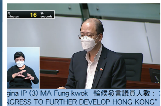
gina IP (3) MA Fung-kwok 輪候發言議員人數：INGRESS TO FURTHER DEVELOP HONG KONG"